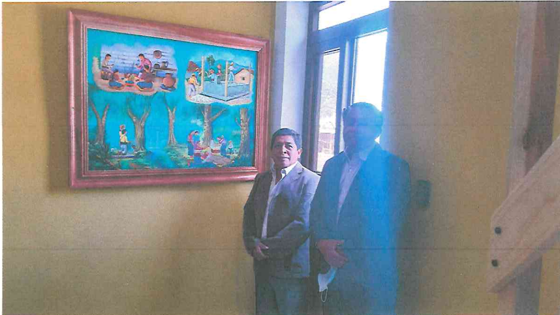
Momento y recorrido de la inauguración de la exposición en la galería IXIM, San Juan la Laguna, Solola.